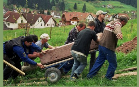
Bauen ist eine Gemeinschaftsleistung

Abschließend wird für die geplanten Projekte ein Vorentwurf entwickelt auf Basis der gefundenen Kriterien. Dieser Vorentwurf kann eine Entwurfsübung der teilnehmenden Bauschaffenden sein und im Anschluss an die Seminare auch zu Zusammenarbeit zwischen Bauschaffenden und Bauwilligen führen.