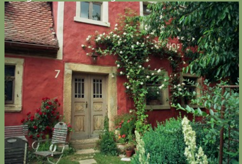
Planung bezieht die Umgebung mit ein