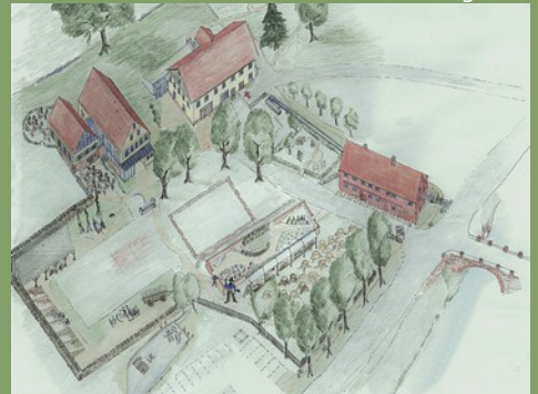
Planung ist die Erstellung des Gebäudes in Gedanken